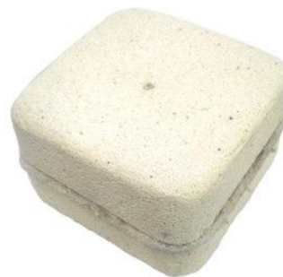
Рисунок 3 - Теплоизоляционная крышка