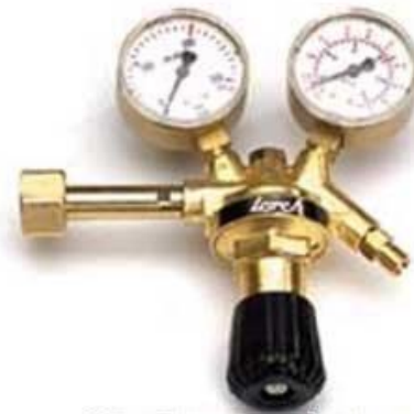
Рисунок 4 Вид редуктора расхода аргона ( ГК140-2 не комплектуется)

6.10 При подключении соблюдать правила ПУЭ, обратить внимание на величину напряжения и других потребителей электроэнергии, подключенных к этой сети. Работа в сети имеющей