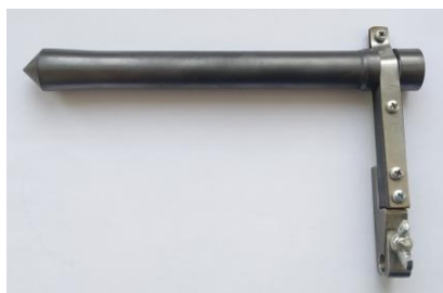
4. Шток-141МПП с зажимом