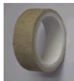
3. Огнеупорное кольцо ОК-140