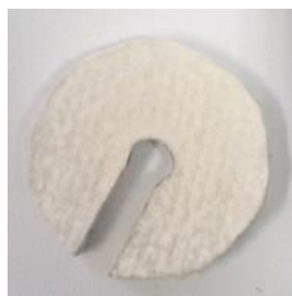
2. Крышка ТК140В