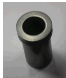
5. Тигель-140МПП с отв 2 мм