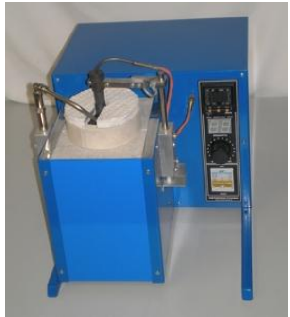
режим донного розлива