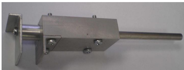
Рисунок 2 – Механизм подъема штока