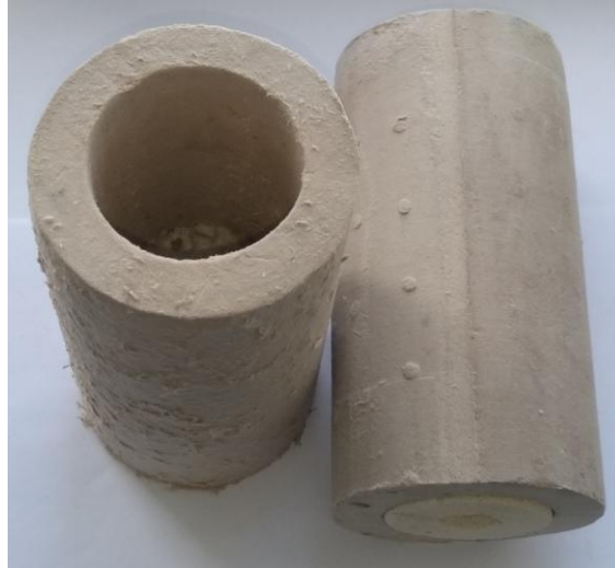
Рисунок 4 - Теплоизоляционная вставка.