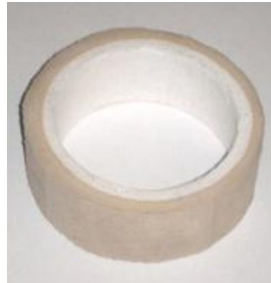
Рисунок 5 - Теплоизоляционная крышка и огнеупорное кольцо.