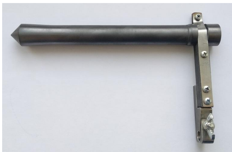
Рисунок 3 – Шток и зажим штока.