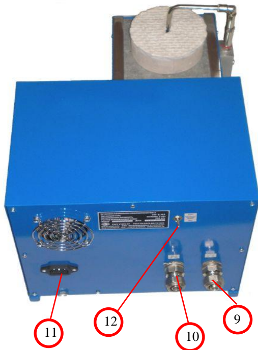
Рисунок 1. Внешний вид установки и устройство плавильной камеры