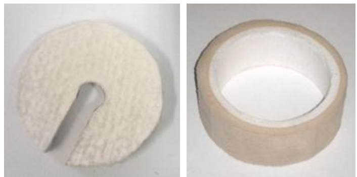
Рисунок 3. Теплоизоляционная крышка и огнеупорное кольцо