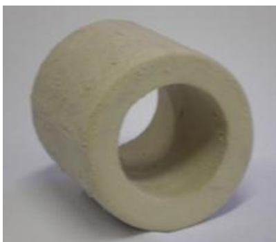
Рисунок 2. Теплоизоляционная вставка

11.3 При транспортировании должна быть обеспечена защита транспортной тары с упакованной установкой от прямого попадания влаги (атмосферных осадков и пыли). При транспортировании – не кантовать!